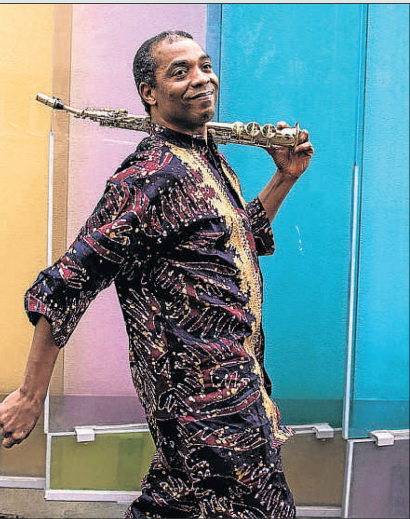
VOLL-DAMM FESTIVAL DE JAZZ DE BARCELONA